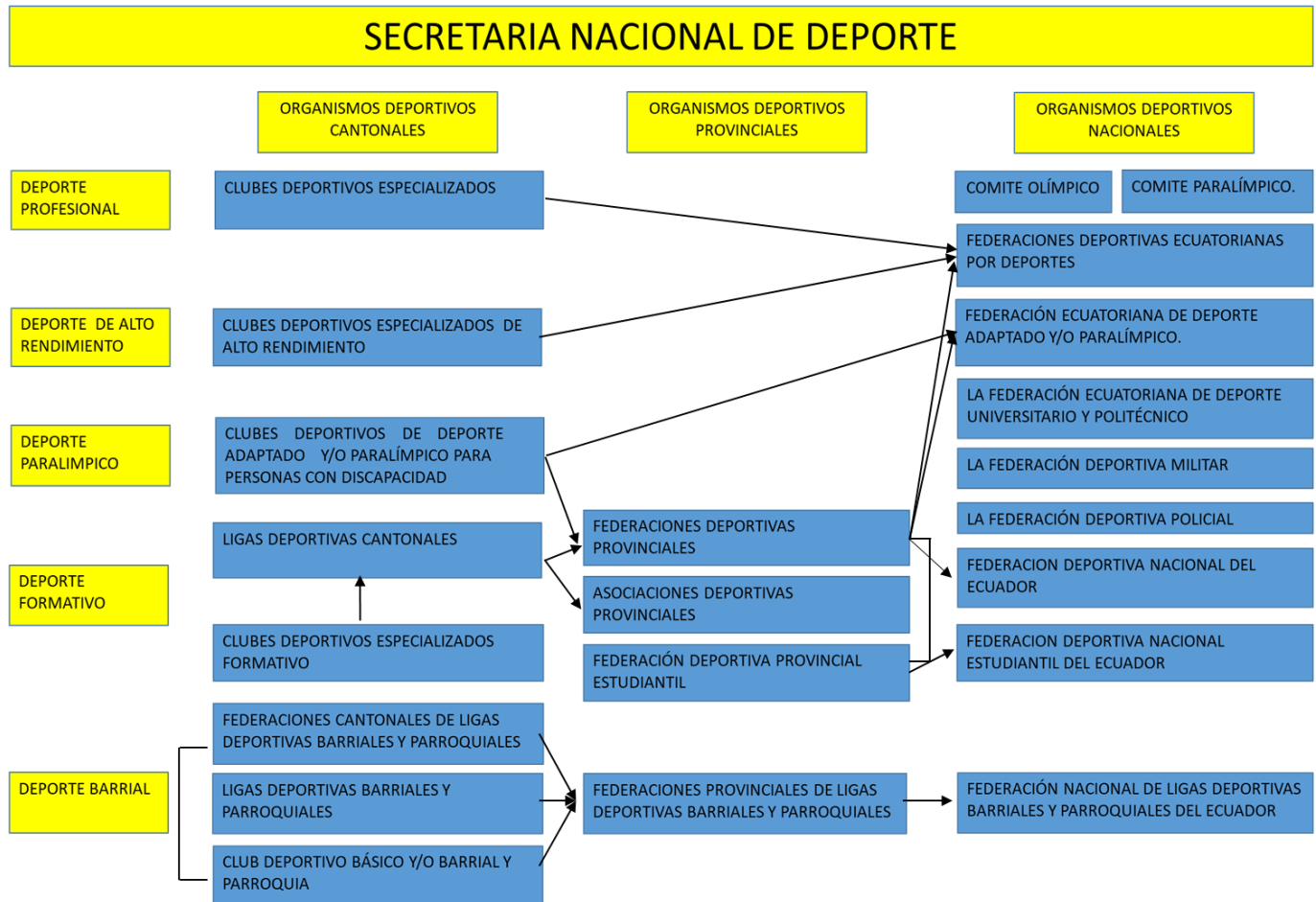
Gráfico Nro. 1 Sistema Deportivo del Ecuador

Elaborado por los autores sobre la base la Ley Del Deporte, Educación Física y Recreación (2015)